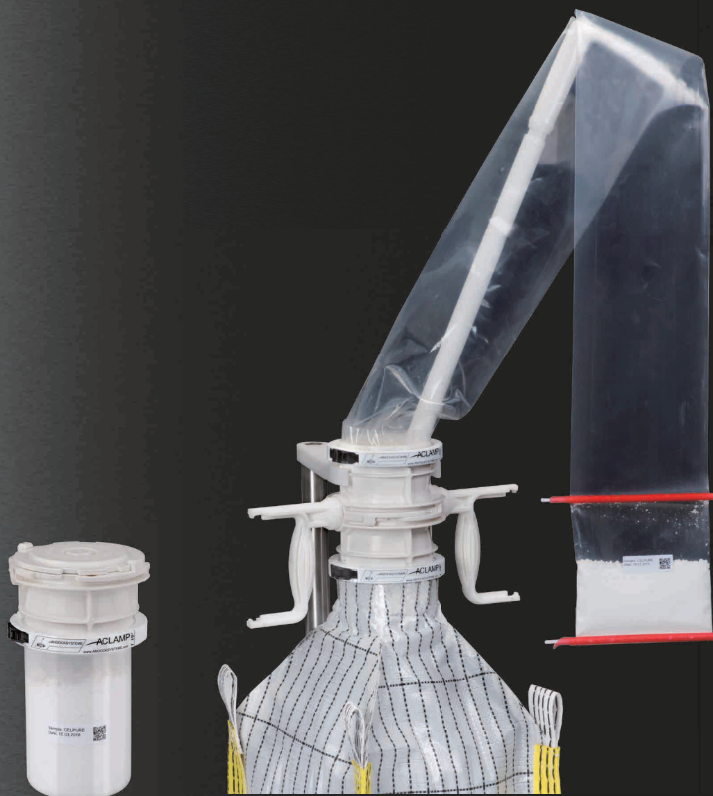
封じ込めサンプリング

Are you still cleaning or being productive