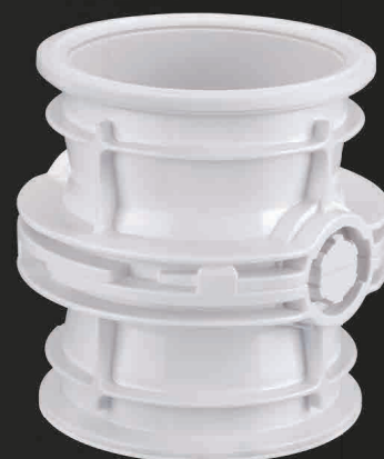
接合後、ロック状態